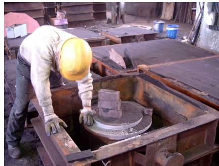
Former beim Einformen eines Modells

Unsere z. Zt. 12 Auszubildenden (darunter 7 Gießereimechaniker) sind voll in den Betriebsablauf integriert und werden von Ausbildern und Kollegen in der Aneignung von theoretischem und praktischem Wissen umfassend unterstützt.