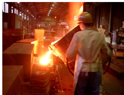
Former beim Abguß

Zur Verstärkung unseres Teams stellen wir jährlich Auszubildende —vor allem Gießereimechaniker —ein.